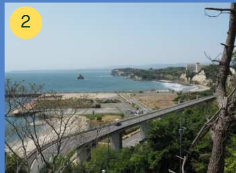
2 いわきサンマリーナ

一面草原で非常に解放感がある。草原の頂上付近には「宇宙石」と呼ばれる巨石があり登ることもできる。