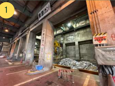
1 富久山クリーンセンター

現役稼働中のごみ回収・焼却施設。モニタールーム、リサイクルセンター等の多様な設備で迫力ある撮影が可能。